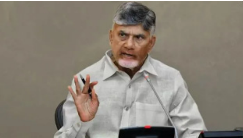
ధర రూ.4గా ఉండేలా తగ్గించాలన్నారు. నూతన టెక్నాలజీని,

విద్యుత్ శాఖ అధికారులతో సీఎం చంద్రబాబు నాయుడు మంగళవారం సమీక్ష నిర్వహించారు. సచివాలయంలో జరిగిన ఈ సమీక్షలో పలు కీలక సూచనలు చేశారు సీఎం. విద్యుత్ కొనుగోలు ఛార్జీలను తగ్గించే అంశంపై అధికారులు దృష్టి సారించాలన్నారు. ఆ దిశగా చేపడుతున్న చర్యలను మరింత ముమ్మరం చేయాలని ఆదేశించారు. ప్రభుత్వం చేపట్టే విద్యుత్ కొనుగోలు ధరను యూనిట్ కు రూ.4కు తగ్గించటం సహా ప్రజలపై భారం వేయకుండా విద్యుత్ సంస్థల రుణాలు తీర్చేందుకు కార్యాచరణ చేపట్టాలని అధికారులకు సూచించారు.